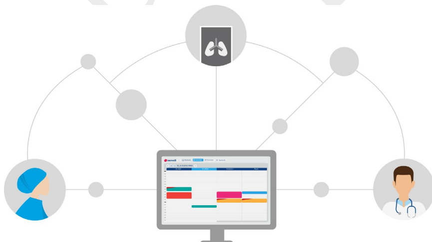
▲ Effiziente Ressourcenplanung und sichere Vernetzung über die Grenzen der einzelnen Arztpraxis und Klinik hinweg